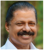
എം വി ഗോവിന്ദൻ മാത്യു തദ്ദേശസ്വയംഭരണ വകുപ്പ് മന്ത്രി