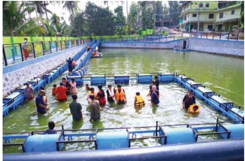
അക്വാട്ടിക് റീഹാബിലിറ്റേഷൻ സെന്റർ

റീഹാബ് എക്സ്പ്രസ്സും റീഹാബ് ഓൺ വീൽസും വീൽസ് ട്രാൻസും നിപ്മററിന്റെ ജനകീയമായ പദ്ധതികളാണ്. റീഹാബ് എക്സ്പ്രസ്സിലൂടെ ഭിന്നശേഷിക്കാർക്കുള്ള തെറപ്പി സേവനങ്ങൾ വീട്ടിലെത്തും. നിപ്മറും സാമൂഹികസുരക്ഷാ മിഷനും ചേർന്നാണ് ഇത് നടപ്പാക്കുന്നത്. കെഎസ്ആർടിസിയുടെ ലോഫ്ളോർ ബസ്ഇതിനായി മാറ്റിയെടുത്തു. ഫിസിയോ തെറപ്പി, ഒക്കുപേഷനൽ തെറപ്പി, സ്പീച്ച് തെറപ്പി ഉൾപ്പെടെയുള്ള സേവനങ്ങൾ, ഡോക്ടർമാരുടെയും വിവിധ തെറപ്പിസ്റ്റുകളുടെയും സേവനം തുടങ്ങിയവ ഇതിലുണ്ട്.