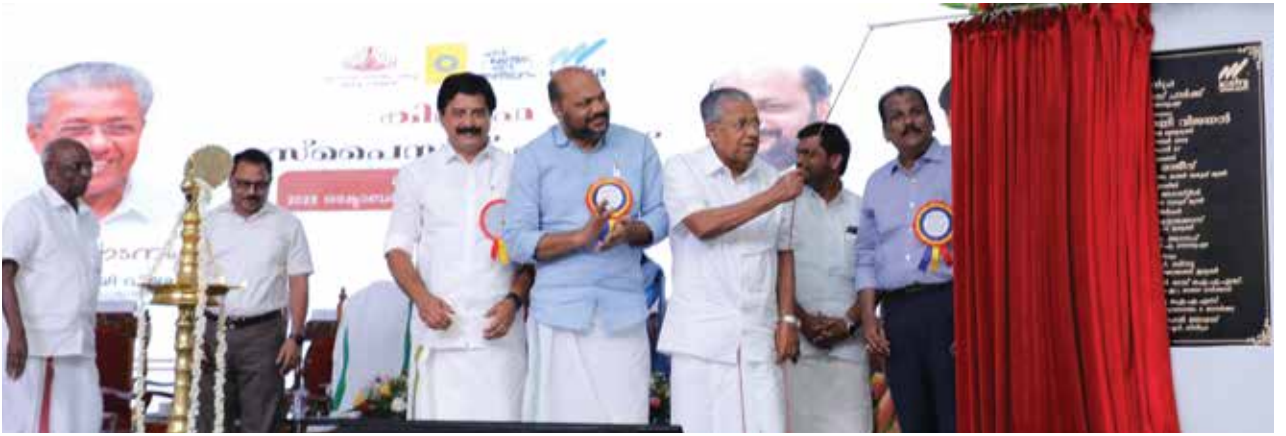
ഇടുക്കിയിലെ കിൻഫ്ര സ്പെസ് പാർക്ക് ശിലാസ്ഥാപനം മുഖ്യമന്ത്രി പിണറായി വിജയൻ നിർവഹിക്കുന്നു