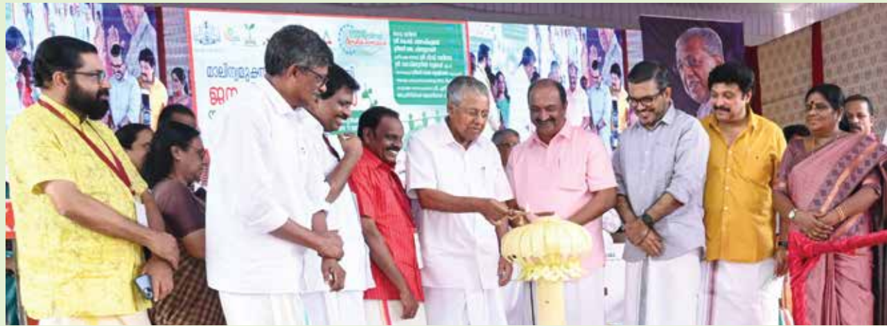
മാലിന്യമുക്തം നവകേരളം ജനകീയ ക്യാമ്പയിനിന്റെ സംസ്ഥാനതല ഉദ്ഘാടനം കൊട്ടാരക്കരയിൽ മുഖ്യമന്ത്രി പിണറായി വിജയൻ നിർവഹിക്കുന്നു

അതിവേഗം നഗരവൽക്കരിക്കപ്പെടുന്ന സംസ്ഥാനമാണ് കേരളം. 2035 ഓടെ കേരളത്തിലെ ജനസംഖ്യയുടെ 90 ശതമാനവും നഗരജനസംഖ്യയായി മാറുമെന്നാണ് പഠനങ്ങൾ സൂചിപ്പിക്കുന്നത്. ഈ സാഹചര്യത്തിൽ മാലിന്യസംസ്കരണം എന്നത് നാം വളരെ ഗൗരവത്തോടെ ഏറ്റെടുക്കണം. സുസ്ഥിരവും പ്രകൃതി