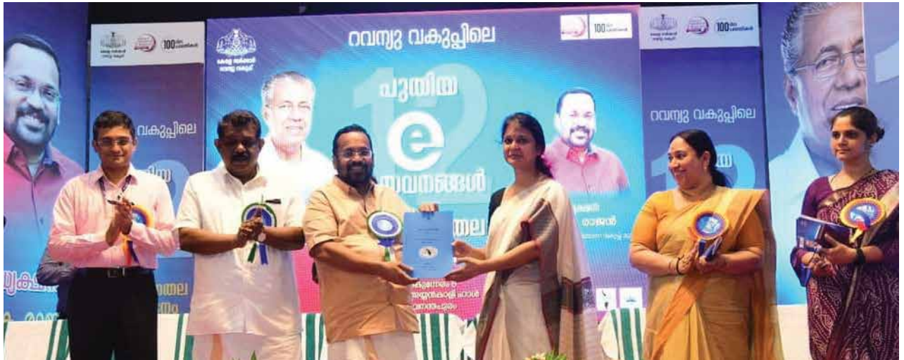
റവന്യൂ വകുപ്പ് നടപ്പിലാക്കുന്ന പുതിയ 12 ഇ-സേവനങ്ങളുടെ ഉദ്ഘാടനം മുഖ്യമന്ത്രി പിണറായി വിജയൻ ഓൺലൈനായി നിർവഹിച്ചു

പ്രവർത്തനങ്ങളിൽ വേഗതയും സുതാര്യതയും ഉറപ്പാക്കുന്നതിന്റെ ഭാഗമായി സേവനങ്ങൾ പൂർമായും ഡിജിറ്റൽ ആക്കുന്നതിനുള്ള പരിശ്രമത്തിലാണ് റവന്യൂ വകുപ്പ്. എല്ലാവർക്കും ഭൂമി, എല്ലാ ഭൂമിക്കും രേഖ, എല്ലാ സേവനങ്ങളും സ്റ്റാർട്ട് എന്ന നയത്തിലൂന്നി 27 സേവനങ്ങൾ ആദ്യഘട്ടത്തിൽ ഡിജിറ്റലാക്കിയ റവന്യൂ വകുപ്പ് ഇപ്പോൾ 12 ഇനങ്ങൾ കൂടി പട്ടികയിലേക്ക് ചേർത്തു. സംസ്ഥാനത്തിനകത്തുള്ളവർക്ക് മാത്രമല്ല, വിദേശ രാജ്യങ്ങളിലെ മലയാളികൾക്കും അവരുടെ നാട്ടിലുള്ള ഭൂമിസംബന്ധമായ രേഖകൾ ലഭ്യമാക്കാനുള്ള സൗകര്യമൊരുക്കി ചരിത്രം സൃഷ്ടിക്കുകയാണ് വകുപ്പ്.