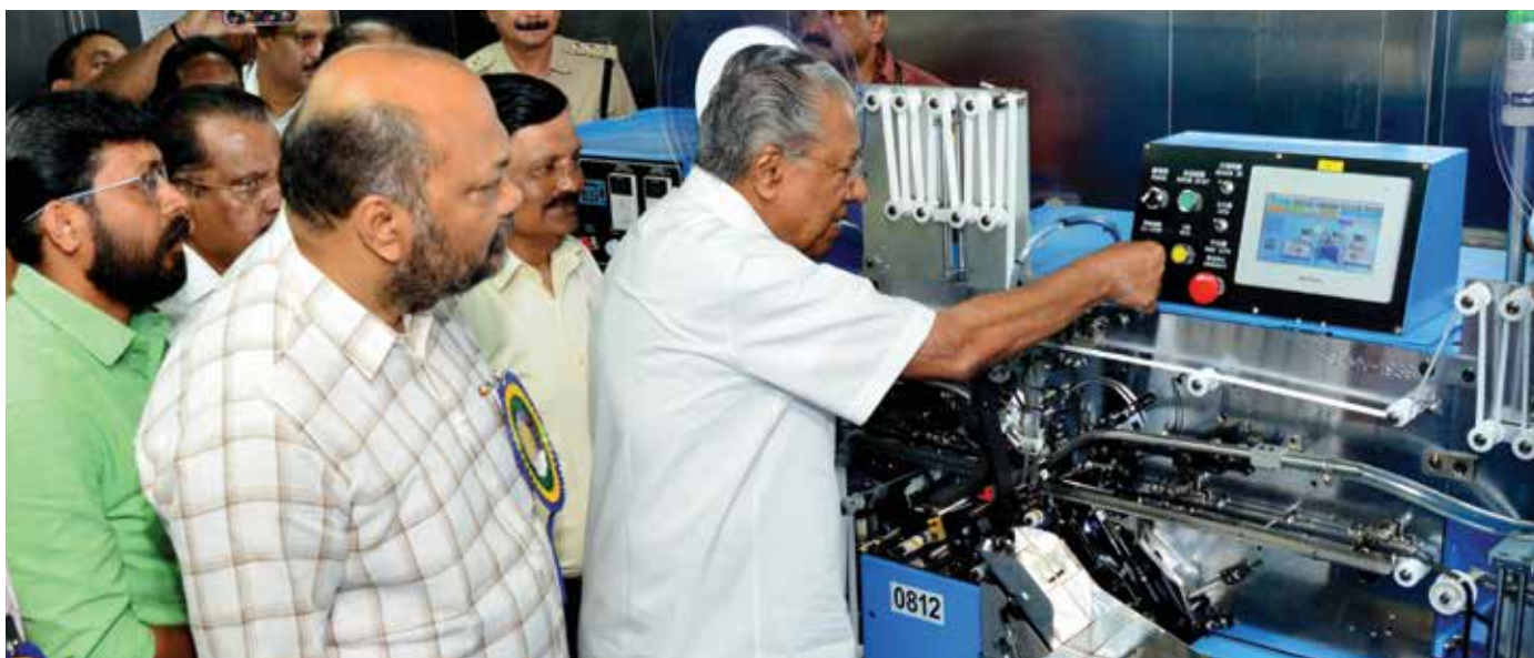
ഇന്ത്യയിലെ ആദ്യ സൂപ്പർ കമ്പോസിറ്റർ ഉൽപാദനകേന്ദ്രം കല്യാശേരിയിലെ കണ്ണൂർ കെൽട്രോൺ കോമ്പണിന്റേ കോംപ്ലക്സ് ലിമിറ്റഡിൽ മുഖ്യമന്ത്രി പിണറായി വിജയൻ ഉദ്ഘാടനം ചെയ്യുന്നു

ശ്രമിച്ചു എന്നാണ്. എന്നാൽ കേരളത്തിൽ യൂണിറ്റ് ആരംഭിക്കുന്നതിന് ഒരു തടസ്സവും തനിക്കുണ്ടായില്ല. അപേക്ഷ നൽകി ഒരാഴ്ചക്കകം എല്ലാ ലൈസൻസുകളും ലഭ്യമായി എന്നാണ്. ഇതാണ് കേരളം. കേരളത്തെ സംബന്ധിച്ച് ഇതൊരു പ്രധാന വാർത്തയുമാണ്. എന്നാൽ എത്ര ദൃശ്യമാധ്യമങ്ങൾ ഈ വാർത്ത നൽകിയിട്ടുണ്ട് എന്നത് അവർ തന്നെ സ്വയം വിമർശനപരമായി ചിന്തിക്കേണ്ട കാര്യമാണ്.