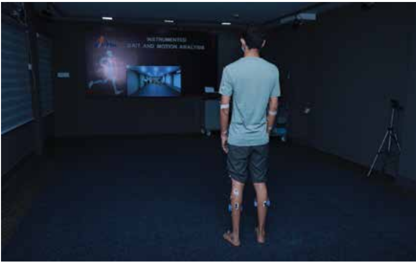
വെർച്വൽ റീഹാബിലിറ്റേഷൻ സെന്റർ

തെരപ്പി സൗകര്യം ഇല്ലാത്ത മേഖലകളിൽ കൂടി സേവനമെത്തിക്കുകയാണ് ലക്ഷ്യം. തദ്ദേശസ്ഥാപനങ്ങളും സന്നദ്ധസംഘടനകളും ആവശ്യപ്പെടുന്നതനുസരിച്ചാണ് റീഹാബ് എക്സ്പ്രസ് പ്രദേശത്ത് ക്യാമ്പ് ചെയ്യുക. റീഹാബ് ഓൺ വീൽസിലൂടെ