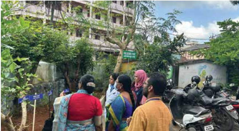
കേന്ദ്ര ആരോഗ്യ മന്ത്രാലയത്തിന് കീഴിലെ സംഘം കോട്ടയ്ക്കലിൽ പരിശോധനയ്ക്കെത്തിയപ്പോൾ