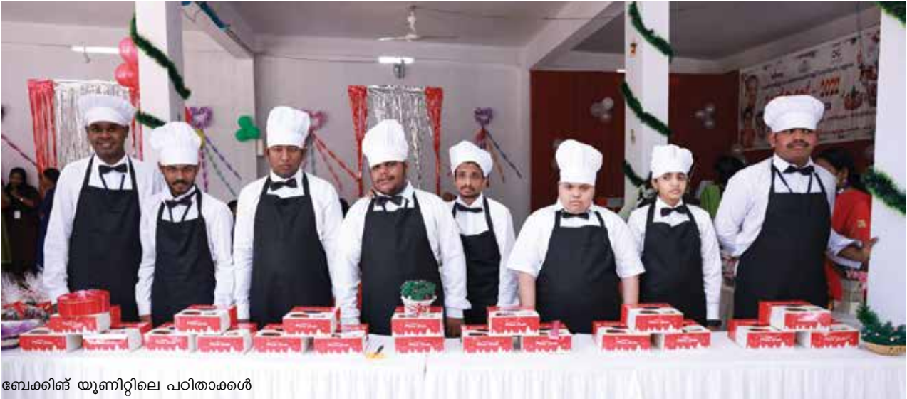
ബേക്കിങ് യൂണിറ്റിലെ പഠിതാക്കൾ

ബോട്ടം ചുറ്റും വീൽചെയർ ആംബുലേഷൻ ട്രാക്കും നിർമ്മിച്ചിട്ടുണ്ട്.