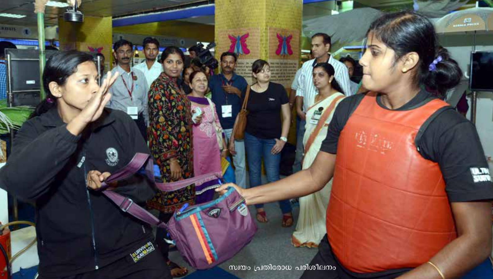
സ്വയം പ്രതിരോധ പരിശീലനം

ഹെൽപ് ഡെസ്കുകളുടെ പ്രവർത്തനം ശക്തമാക്കി. പഞ്ചായത്തിൽ ഒരു വനിതാപോലീസ് ഉദ്യോഗസ്ഥ ആഴ്ചയിലൊരിക്കലെത്തി സ്ത്രീകൾക്കെതിരെയുള്ള അതിക്രമങ്ങളിൽ പരാതികൾ സ്വീകരിക്കുന്നതിന് നടപടിയായി. 24 മണിക്കൂറും സ്ത്രീകൾക്ക് സഹായത്തിനായി വിളിക്കാവുന്ന 1091 എന്ന വനിതാ ഹെൽപ് ലൈൻ നമ്പറും സാമൂഹികനീതിവകുപ്പ് പോലീസ് ഉൾപ്പെടെയുള്ള ഏജൻസികളുമായി ചേർന്ന് നടത്തുന്ന 181 എന്ന സഹായക നമ്പറും പിങ്ക് പട്രോൾ സംവിധാനത്തിനു പുറമേ എല്ലാ ജില്ലകളിലും നിലവിലുണ്ട്. ഇതുകൂടാതെ ഒരു എസ്.പിയുടെ നേതൃത്വത്തിൽ സംസ്ഥാന വനിതാസെൽ, വനിതാ സി.ഐയുടെ ചുമതലയിൽ സുസജ്ജമായ ജില്ലാ വനിതാ സെല്ലുകൾ എന്നിവയും പ്രവർത്തിക്കുന്നു.