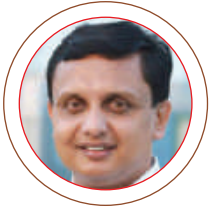
പി എ മുഹമ്മദ് റിയാസ് പൊതുമരാമത്ത്, ടൂറിസം വകുപ്പ് മന്ത്രി

ജനങ്ങൾക്കായി തുറന്നുകൊടുത്ത പൊതുമരാമത്ത് വകുപ്പിന്റെ റസ്റ്റ് ഹൗസുകളുടെ ഓൺലൈൻ ബുക്കിംഗ് സംവിധാനം ചുരുങ്ങിയ ദിവസങ്ങൾക്കുള്ളിൽ ജനകീയമായി