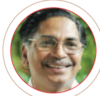
പ്രൊഫ. വി. മധുസൂദനൻ നായർ

ഭാഷ മഹാസ്മൃതിയാണ്. ചരിത്രങ്ങൾക്കപ്പുറം ഒരു സമൂഹം ഒരുമിച്ചുചിട്ടിച്ചിട്ടിന്റെ സംഗീതം ഒഴുകിയൊഴുകിവന്നത്. അതിനാൽ ഇന്നത്തെ ജനതയുടെ ഓർമ്മബലവും ആത്മബലവും ഒരുമയും ഭാഷയിലാണ്. രണ്ടായിരം വർഷത്തിലേറെ ആധാരബലമുള്ള മലയാളഭാഷ കേരളീയന്റെ സാമൂഹികമായ നിലനിൽപ്പിന് ഏകാധാരമാണ്